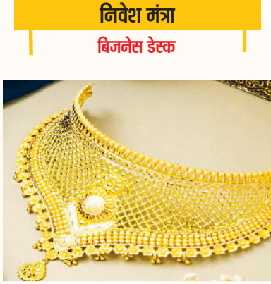
निवेश मंत्रा बिजनेस डेस्क

इस समय सोना निवेश का बढ़िया विकल्प बनकर उभर रहा है। जेन जी और मिलेनियल्स यानी युवा भारतीयों का सोने पर भरोसा मजबूत बना हुआ है, लेकिन इसे खरीदने का तरीका धीरे-धीरे बदल रहा है। स्मिप्टन पल्सएआई के सर्वे में सामने आया है कि सोने की खरीद अब अधिक व्यक्तिगत और छोटी रकम/मात्रा में होने लगी है। 18-39 वर्ष के 5,000 उपभोक्ताओं पर आधारित इस अध्ययन के अनुसार पारंपरिक, परिवार-केंद्रित खरीदारी की जगह अब तर्क-आधारित और व्यक्तिगत फैसलों का महत्व बढ़ रहा है। जेन जी और मिलेनियल्स सोने की खरीद को अब शादी-समारोह से आगे बढ़कर व्यक्तिगत माइलस्टोन और पहली सैलरी जैसे शुरुआती निवेश के रूप में देख रहे हैं।