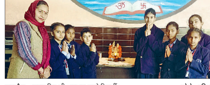
खरखौदा। भगवान शिव की आराधना करते विद्यार्थी।