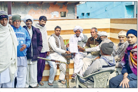
गोहना। जिला उपायुक्त के नाम लिखे गए पत्र के साथ ग्रामीण।