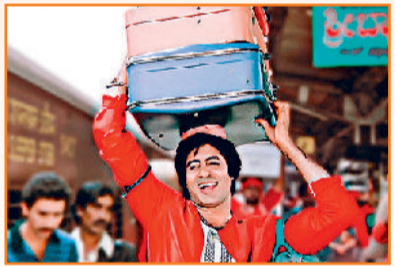
फिल्म 'कुली' के सीन में अमिताभ बच्चन