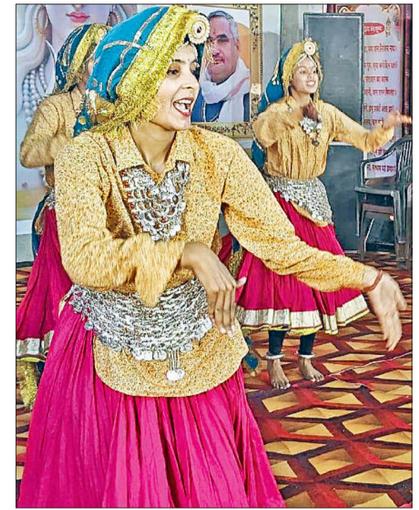
गन्नौर। हरियाणा कला परिषद के रोहताक मंडल के कलाकार सांस्कृतिक कार्यक्रमों की प्रस्तुति देते हुए।