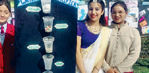
सोनीपत। गेटवे इंटरनेशनल स्कूल में प्रदर्शनी के दौरान अपना मॉडल प्रस्तुत करते विद्यार्थी।

गेटवे इंटरनेशनल स्कूल में शनिवार को पीवीएल कल्चिनेशन (लर्निंग मेला) का आयोजन किया गया। जिसमें कक्षा तीसरी से आठवीं तक के विद्यार्थियों ने अनुभव आधारित शिक्षण के अंतर्गत अलग-अलग कक्षाओं के अनुसार अपनी अधिगम यात्रा की प्रस्तुति दी। तीसरी कक्षा के छात्रों ने स्काई एंड टेस्टाडल, चौथी कक्षा के छात्रों ने फार्म टू प्लेट, पांचवी कक्षा के छात्रों ने फूड प्रिसेवेशन जैसे विषय के अंतर्गत अपनी भागीदारी एवं सीखने की प्रतिभा को दर्शाया। छठी