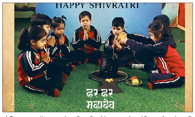
सोनीपत। साउथ पॉइंट स्कूल में महाशिवरात्रि पर्व के उपलक्ष्य में आयोजित कार्यक्रम में प्रस्तुति देते नन्हे विद्यार्थी।

सभी लोगों को मंत्रमुग्ध कर दिया। कार्यक्रम के दौरान विद्यार्थियों ने न केवल शानदार प्रस्तुतियां दीं, बल्कि महाशिवरात्रि के आध्यात्मिक महत्व को भी समझा। विद्यालय के प्रांगण में चारों ओर उत्साह का वातावरण था और बच्चों के उत्साह को देखकर अभिभावक व शिक्षक भावविभोर हो उठे। साउथ पॉइंट