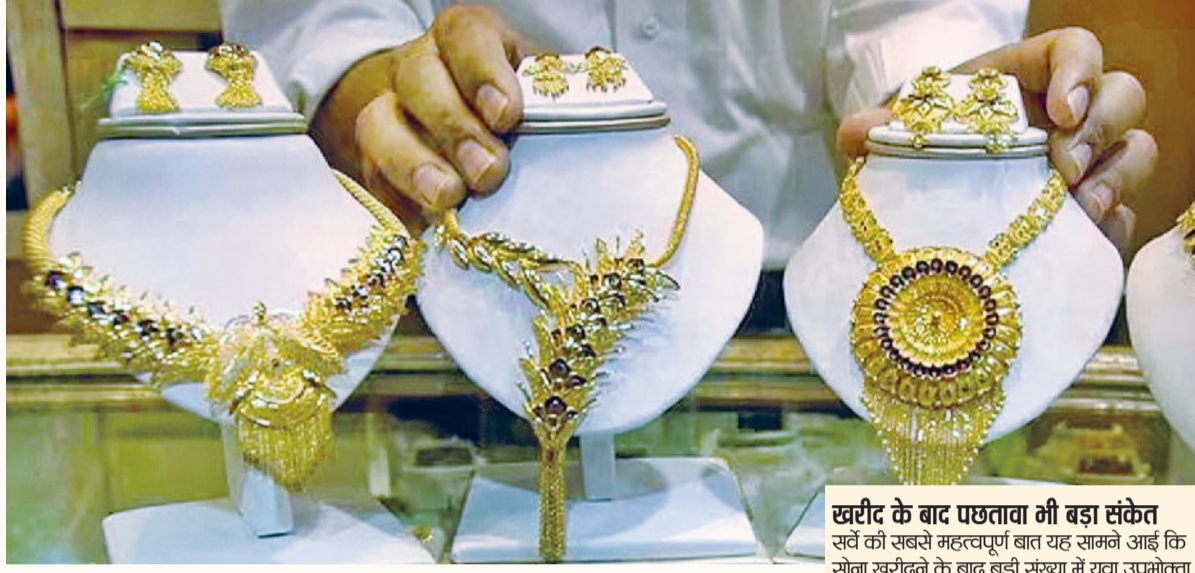
खरीद के बाद पछतावा भी बड़ा संकेत

सर्वे की सबसे महत्वपूर्ण बात यह सामने आई कि सोना खरीदने के बाद बड़ी संख्या में युवा उपभोक्ता असमंजस या पछतावा महसूस करते हैं। करीब 67.1% उत्तरदाताओं ने माना कि उन्हें अवसर या कमी-कमी सोना खरीदने के बाद पछतावा हुआ है। इसके पीछे सबसे बड़ी वजह खरीदी गई कीमत (38.9%) रही, जबकि 33.5% लोगों ने ज्वेलरी, डिजाइन या डिजिटल गोल्ड जैसे फॉर्मेट को लेकर भ्रम को कारण बताया। वहीं 18.8% ने पर्याप्त जानकारी के अभाव को जिम्मेदार ठहराया। यह ट्रेंड दिखाता है कि सोने पर भरोसा मजबूत है, लेकिन खरीद प्रक्रिया को लेकर युवाओं का आत्मविश्वास अभी भी पूरी तरह विकसित नहीं हुआ है।