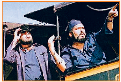
फिल्म 'विधाता' में दिलीप कुमार-शमी कपूर