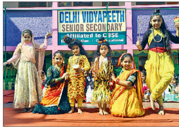
सोनीपत। देवू रोड स्थित दिल्ली विद्यापीठ में शिवरात्रि के उपलक्ष्य में सांस्कृतिक कार्यक्रम प्रस्तुत करते विद्यार्थी।