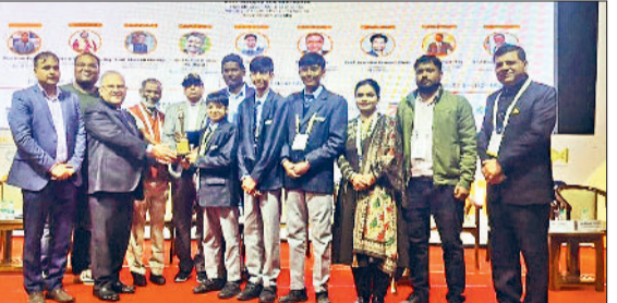
सोनीपत। कार्यक्रम के दौरान विद्यार्थियों को सम्मानित करते हुए।

की, जिससे उन्हें वास्तविक जीवन का अनुभव और आईडियाज को अमरदार प्रोडक्ट्स में बदलने के बारे में जानकारी मिली। मशहूर एंटीएल स्टूडेंट टेक्नोलॉजी शोकेस के दौरान, ब्राइट स्कॉलर सीनियर सेकेंडरी स्कूल की दो टीमों ने बड़े कॉन्फिडेंस और क्रिएटिविटी के साथ अपने इनोवेटिव आईडिया पेश किए