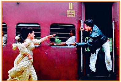
'दिलवाले दुल्हनिया ले जाएंगे' का क्लासिक सीन